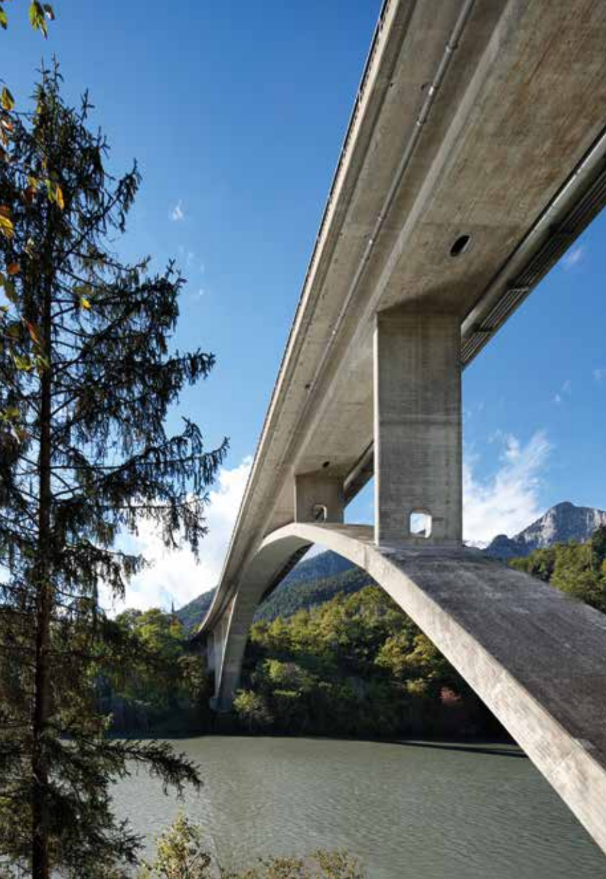
Rheinbrücke bei Tamins von Christian Menn