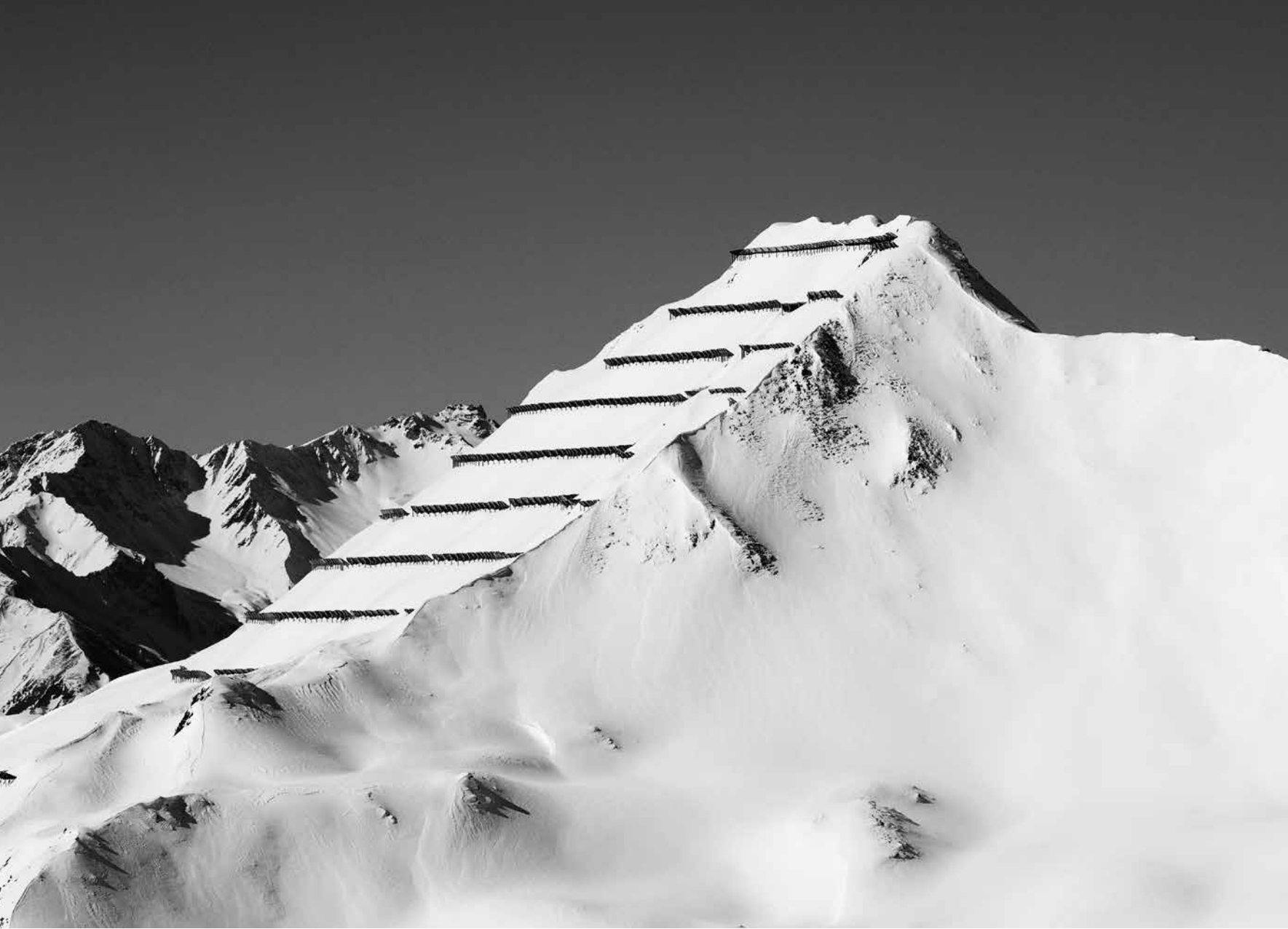
Lawinerverbauung St. Antönien