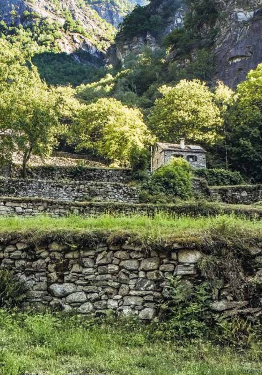
Das Tessiner Bavenatal