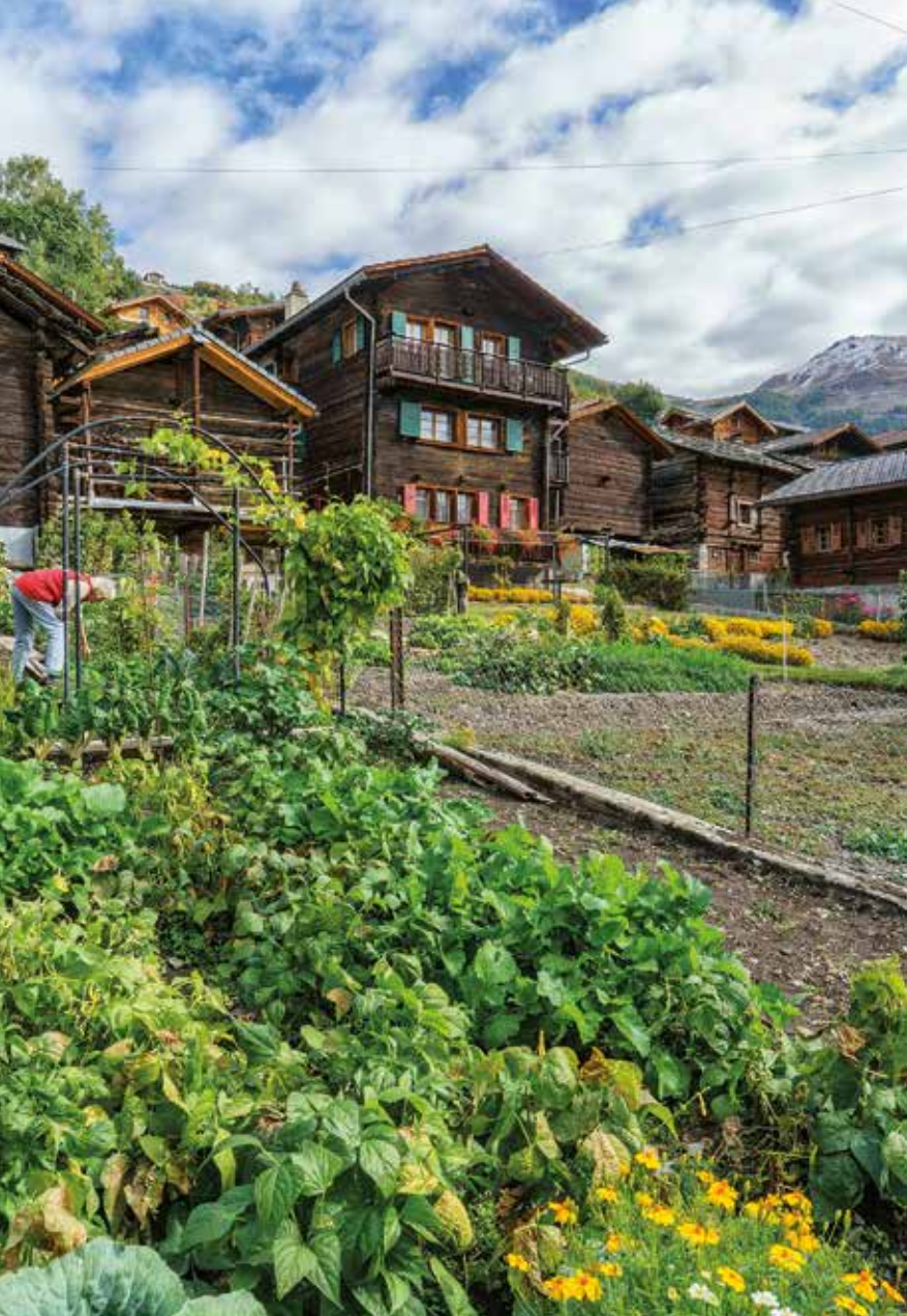
Le village de Mase