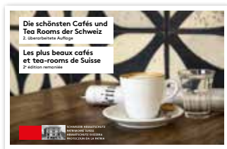
Publications «Les plus beaux...»