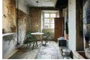
Vacanze in edifici storici