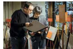
Heimatschutzzentrum in der Villa Patumbah